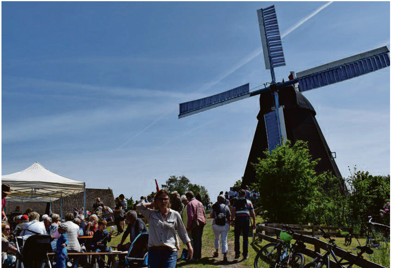
Die Mühle Paula ist die letzte in der Region, die noch produziert.