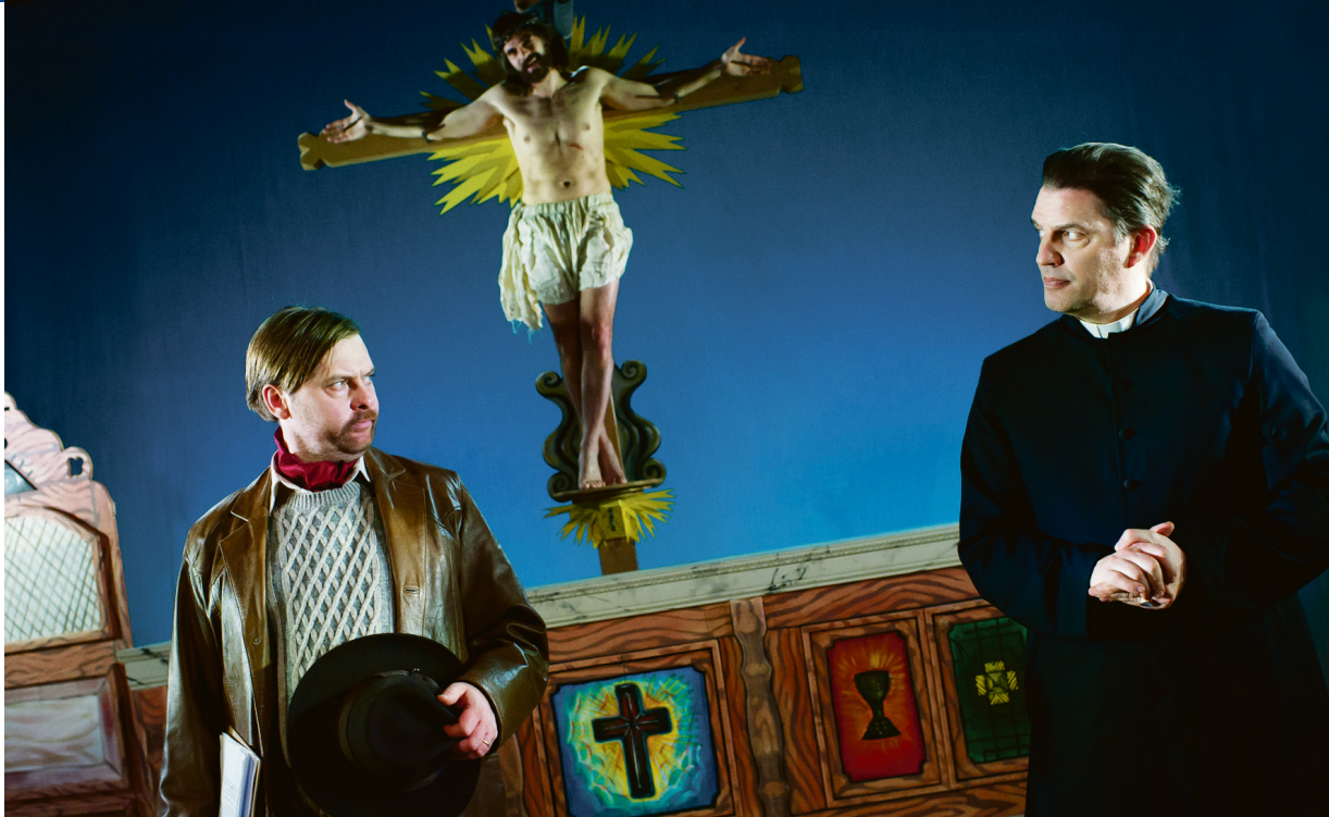
Die Bad-Nenndorf-Boys sind am frühen Samstagabend zu sehen und zu hören. Hermann Posch