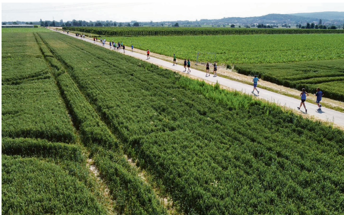
Die Teilnehmer am Volkslauf begeben sich auf unterschiedliche Strecken in der Ohndorfer Feldmark.