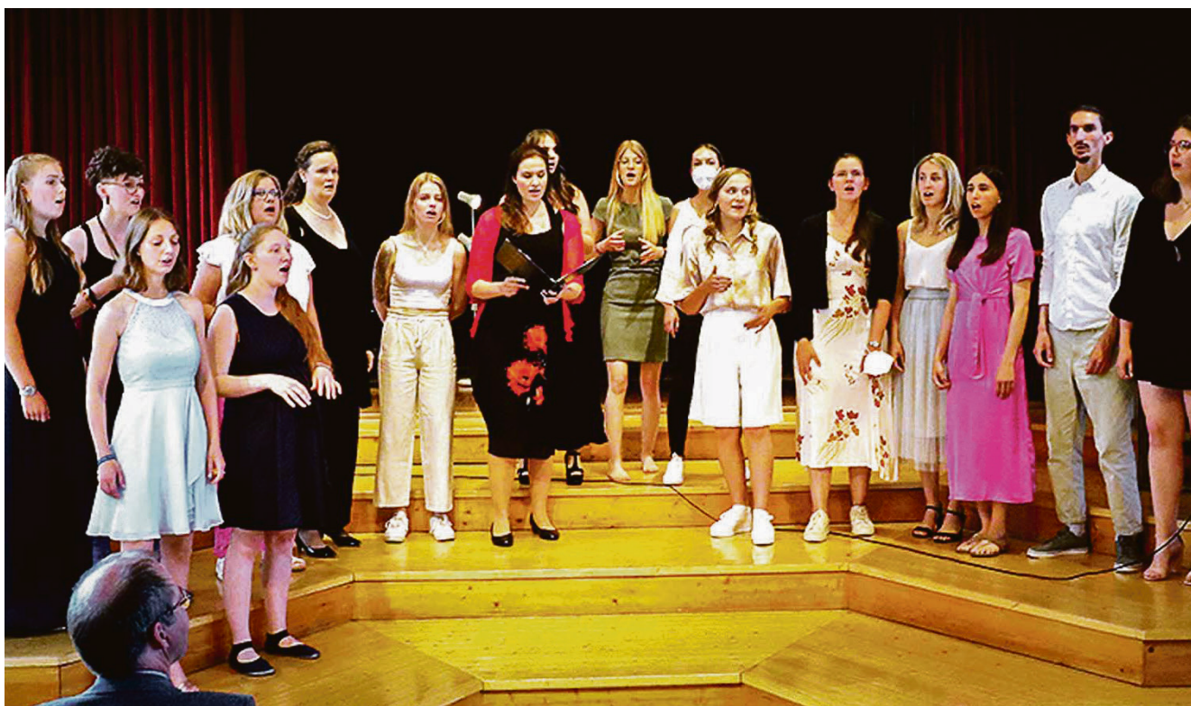
Die Schülerinnen und Schüler der CJD-Schule zeigen beim Konzert ihr Können.