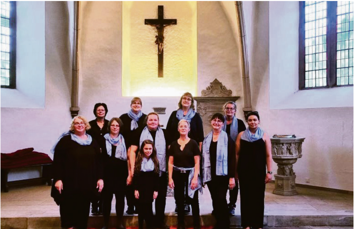
Der Gebärdenor möchte seinem Publikum ein besonderes Konzerterlebnis bieten.