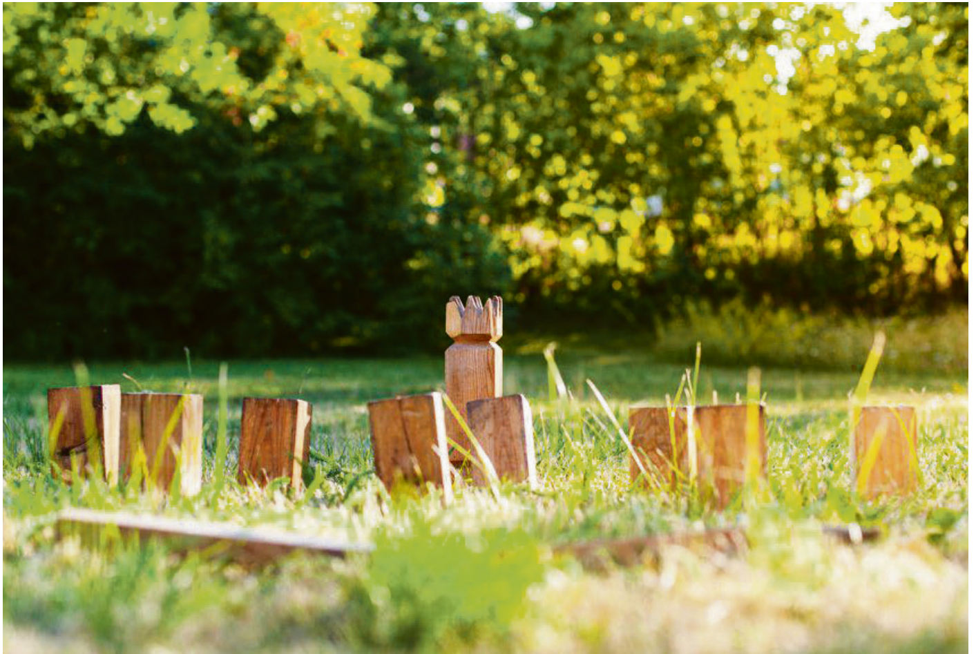
Kubb-Hölzer stehen in Algesdorf derzeit besonders hoch im Kurs.