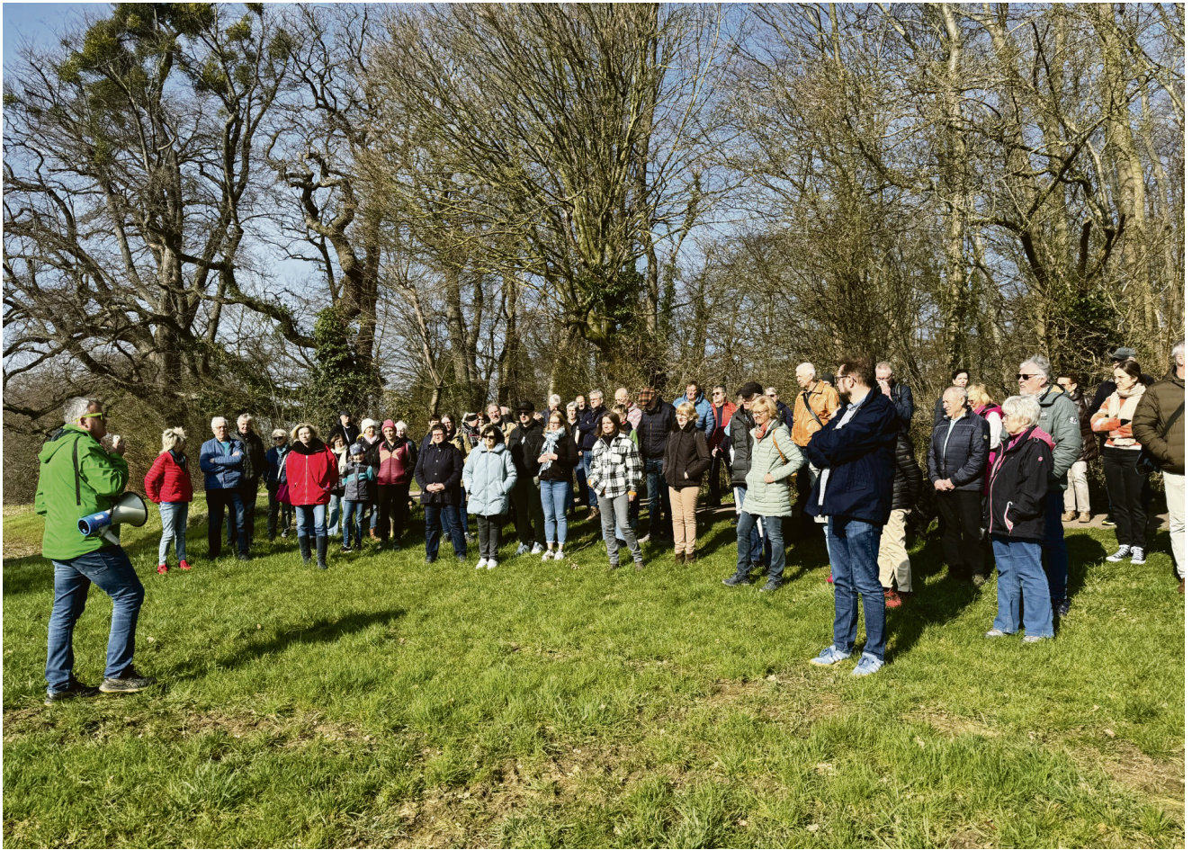
Beim Rundgang erfahren die Teilnehmer den aktuellen Stand zum Thema Landesgartenschau 2026.