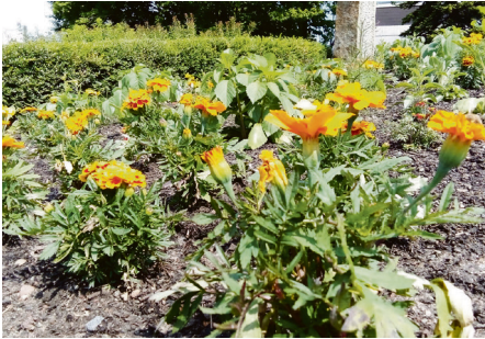
Wo in Bad Nenndorf ist diese Karte zu finden? gus

Im Bad Nenndorfer Kurpark wird wegen der Landesgartenschau schon viel gearbeitet. Daher fällt die Blütenpracht dort in diesem Frühjahr und Sommer etwas weniger üppig aus. Doch an anderer Stelle hat der Bauhof dafür umso mehr bunte Blumen gepflanzt, um einerseits dem Auge des Betrachters zu schmeicheln, aber auch, um Insekten anzulocken. Das