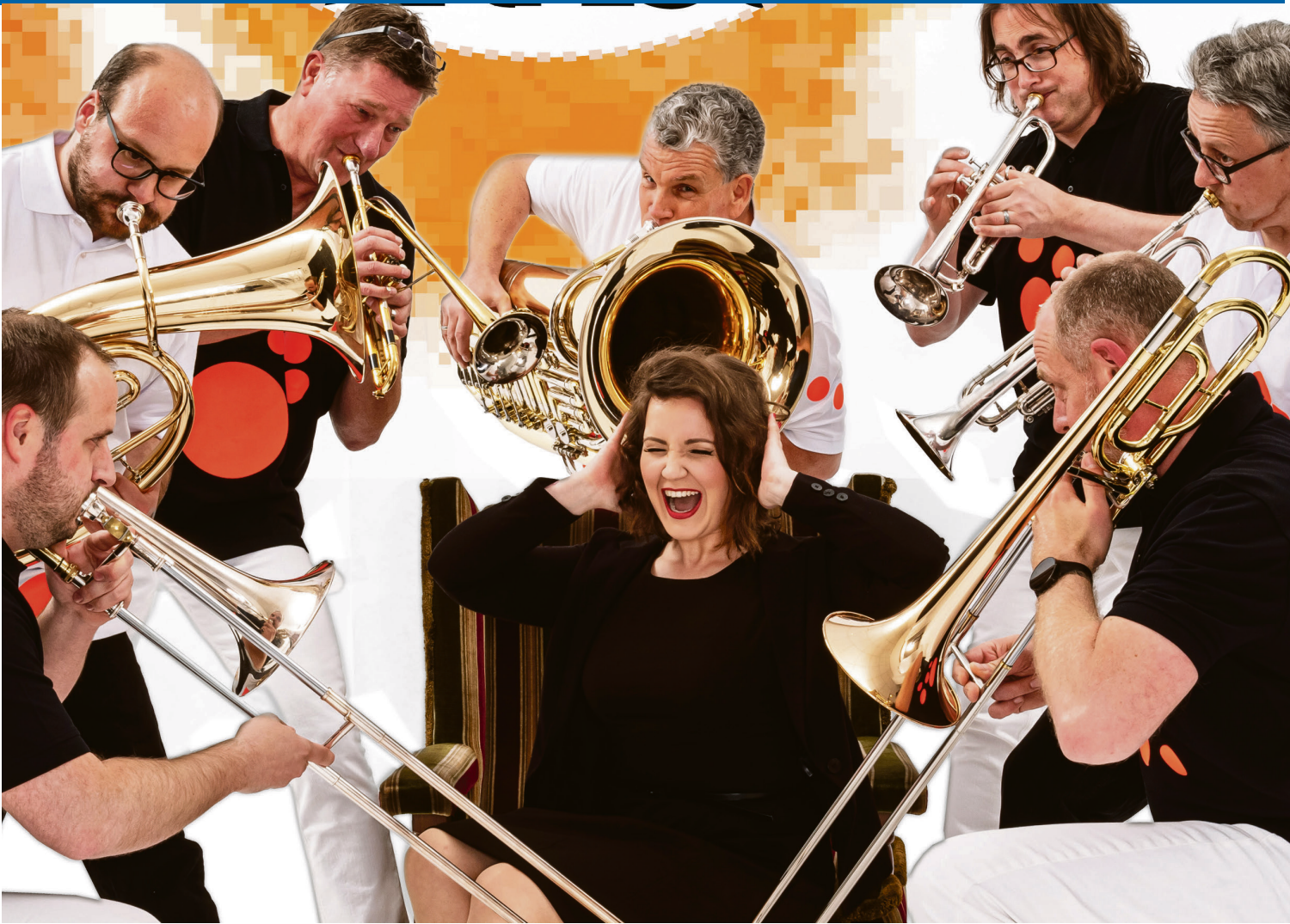
Das Ensemble Kota Brass lebt die Liebe zur Musik voll aus.