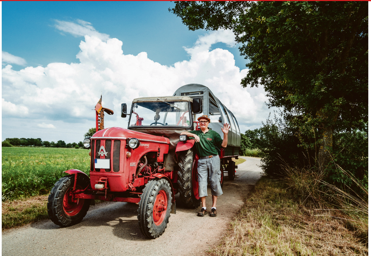
Mit dem Trecker-Planwagen wird die Mooshütte angesteuert.